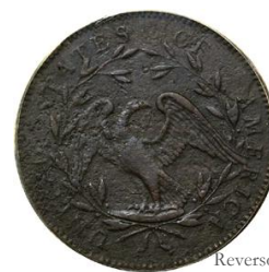
Reverso patrón J18 [Wiki09]