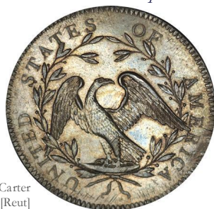
Reverso dólar Carter [Reut]

Comparando los reversos, se observa otra diferencia curiosa: la roca sobre la que se apoya el águila era más alargada en el caso de 1794; otras diferencias se pueden observar entre las ramas de olivo y en los detalles de la cinta que las ata.