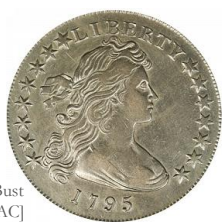
Anverso Draped Bust 'Small Eagle' [USAC]

1795: Se acuñó un nuevo tipo de dólar llamado Draped Bust, variando el busto de la libertad de 1794, pero conservando su reverso; este subtipo se suele referir como el subtipo Águila Pequeña –Small Eagle- haciendo referencia al águila de 1794 para distinguirla del nuevo subtipo que se emitió en 1798 -Heraldic Eagle-.