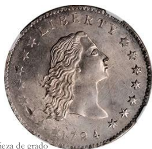
Anverso, pieza de grado MS 64 con acuñación débil [CoinN]

Por ello, las zonas débiles en acuñación se encuentran cerca del borde de la moneda y raramente en su centro.