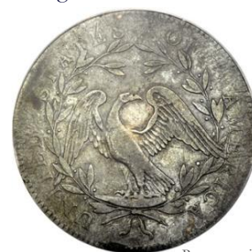
Reverso, pieza de grado VF 35 [Gold]

Por otra parte, los defectos de acuñación señalados anteriormente tampoco deben ser considerados como desgaste por uso; este tipo de huella, el del desgaste, en este tipo de piezas se percibirá usualmente en el centro de la moneda.