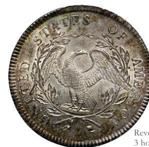
Reverso dólar 1795 3 hojas BB27 [NGC2]

En el tipo de 1795 existen dos variantes importantes según que debajo de las alas del águila aparezcan 2 hojas de olivo –como en las