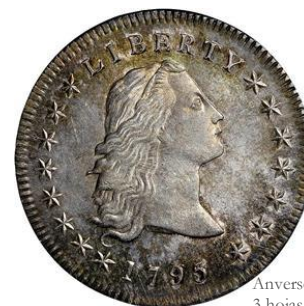
Anverso dólar 1795 3 hojas BB27 [NGC2]

En las piezas de 1794, las estrellas de la izquierda están dispuestas en relación a la gráfila encarando tres puntas; sin embargo, las de la derecha encaran sólo dos puntas. En el caso de 1795, todas presentan la misma