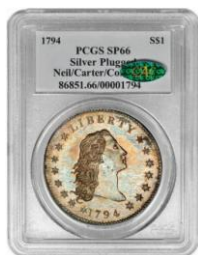
Dólar Carter en cápsula SLAB, con pegatina verde de Certified Acceptance Corp [CoinU]

Se ha determinado que es un espécimen al considerar que se acuñó empleando procedimientos especiales con la intención de conseguir un grado de calidad superior al de las