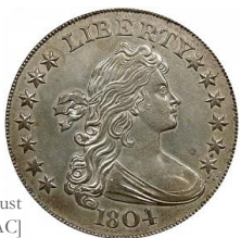
Anverso Draped Bust 'Heraldic Eagle' [USAC]

1798: Se acuñó un nuevo tipo de dólar con el anverso del dólar Draped Bust, cambiando el águila del reverso por un águila que recoge más fielmente el escudo heráldico que aparece en el Gran Sello. Este subtipo se suele referir por ello con el nombre de Águila Heráldica –Heraldic Eagle-.