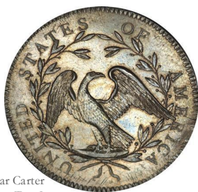
Reverso dólar Carter [Reut]

Fue certificada por PCGS con el grado de SP-66.