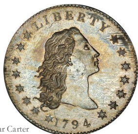
Anverso dólar Carter [Reut]

El CARTER DOLLAR , dólar que se muestra en la imagen, es considerado como una de las piezas más relevantes emitidas por Estados Unidos.