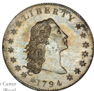
Anverso dólar Carter [Reut]

En el anverso existen diferencias claras en los detalles del cabello; en particular, en el número de rizos.