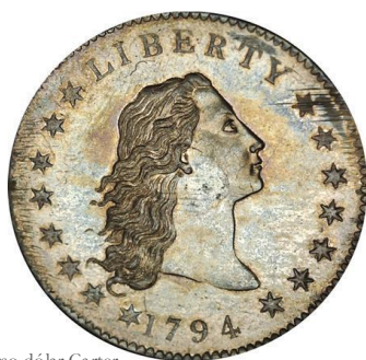
Anverso dólar Carter