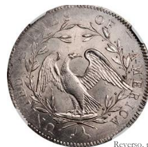
Reverso, pieza de grado MS 64 con acuñación débil [CoinN]

La debilidad en la acuñación más frecuente se suele apreciar en la parte izquierda del anverso –especialmente en la fecha- y en las letras UNITED STATES del reverso.