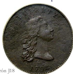
Anverso patrón J18 [Wiki09]

El primer patrón -J18- no mostraba las estrellas que, como en el caso del Gran Sello, representaban los estados de la Unión. Dicho patrón se desechó.