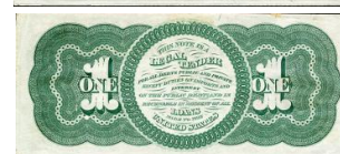
Primer billete 1 dólar [Wiki07]