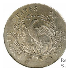
Reverso Draped Bust 'Small Eagle' [USAC]

El tipo 'Small eagle' se emitió hasta 1798.