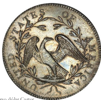
Reverso dólar Carter [Reut]

PARA EL REVERSO, Robert Scott eligió un águila con alas extendidas -águila calva o, llamada también, águila de cabeza blanca-, inspirada en la que aparece en el anverso del Gran Sello, diseñado por Charles Thompson, que el Congreso de los Estados Unidos aprobó en 1872.