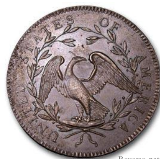
Reverso patrón J19 [Smit2]

estrellas en el anverso y se conservó el reverso del anterior. Este patrón fue adoptado para la acuñación de las monedas circulantes; se conserva en Smithsonian Institution – para más detalles del patrón, ver [Smit1] and [Smit2] –