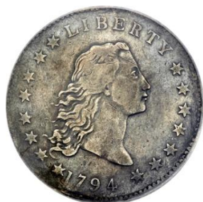
Anverso, pieza de grado VF-35 [Gold]

Todas las piezas tienen marcas de ajuste por las operaciones que se tuvieron que realizar en los cospeles para conseguir que la cantidad de plata fuera la legalmente establecida. Estas marcas no deben ser consideradas como defectos de conservación.