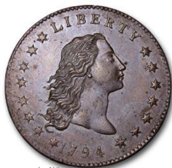
Anverso patrón J19 [Smit2]

Posteriormente diseñó un segundo patrón -J19- en el que se incluyeron las