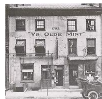
Ceca Filadelfia Foto de 1908 [Wiki04]