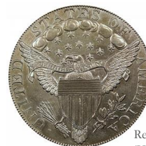
Reverso Draped Bust 'Heraldic Eagle' [USAC]

Este tipo de moneda se emitió hasta 1804.